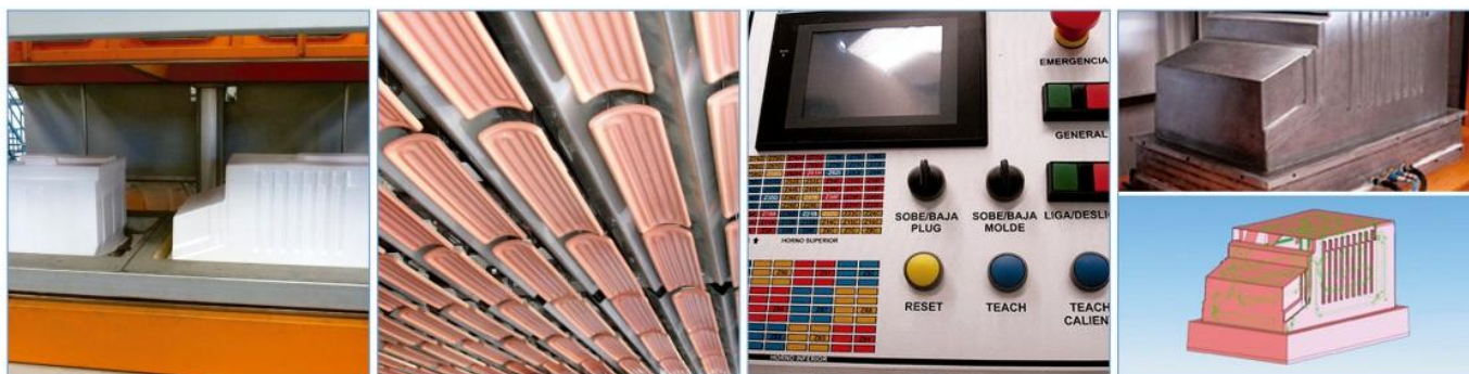
Tabla productividad RV-2

Garantía de 1 año de todas las piezas y componentes.